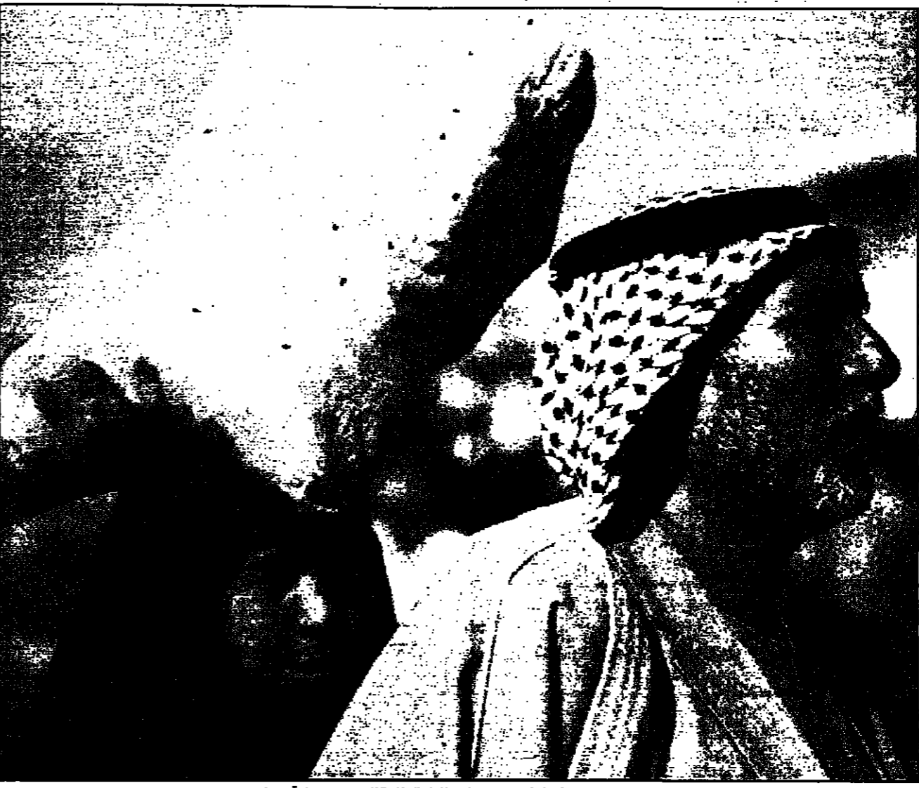
مراتي وثلاثة بعد حصولها على حصتها من المواد الغذائية المقررة في بغداد